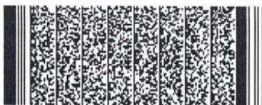
Timbre electrónico SRCel

Verifique documento en www.registrocivil.gob.cl o a nuestro Call Center 600 370 2000, para teléfonos fijos y celulares. La próxima vez, obtén este certificado en www.registrocivil.gob.cl .